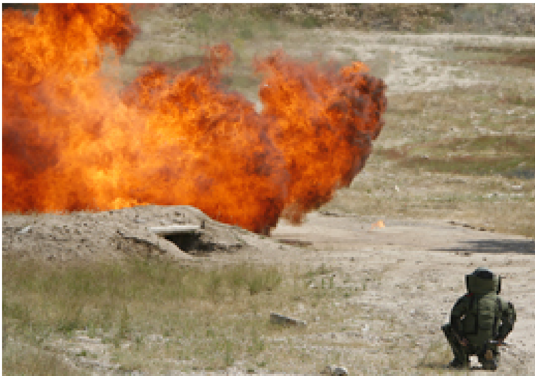
Centro de Excelencia contra Artefactos Explosivos Improvisados - Ministerio de Defensa de España

Subdivisión de Riesgos, comentó que a los soldados se les enseña los fundamentos, cuestiones básicas, y siempre acorde a la zona específica en donde vayan a ser desplegados, puesto que “las tácticas, técnicas y procedimientos” tienen una vida muy corta y cambiante, el aprendizaje específico no resulta operativo puesto que crearía en el soldado una falsa sensación de control y seguridad de la situación que le expondría aún más al no estar siempre vigilante ante cualquier novedad. A los soldados también se les adiestra en el manejo de sofisticado equipo, como el reciente Counter Bomber, que es un dispositivo que detecta suicidas que portan bombas, a más de 100 yardas de distancia. (US Army, 2011)