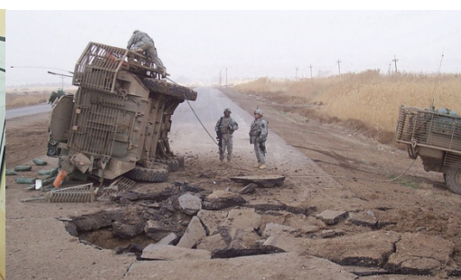
C-52 of 3/2 Stryker Brigade Combat Team

Los soldados del Cuerpo de Marines que se desplazan a misiones en Próximo Oriente reciben entrenamiento específico sobre “Reconocimiento de Combatientes y Dispositivos de Explosivos Improvisados”, en la base militar de