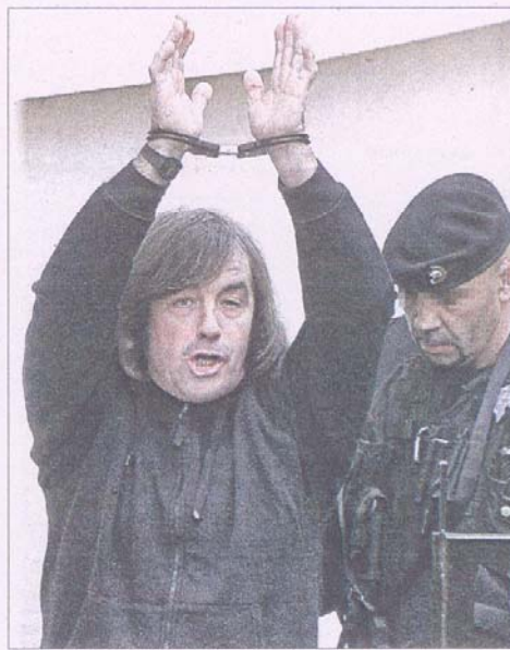
El atracador 'El Soltario' saluda ante las cámaras.

> Tony King. El asesino de Rocio Waninkof y Sonia Carabantes tiene en su grafismo «tendencias desordenadas en la canalización de la libelo, fluctuación desviada del impulso gráfico y ejes geotrópicos inferiores inflados, suspendidos a modo de guadaña».